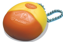
カラフルでかわいい キーホルダータイプ