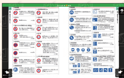
▲ デジタル教本画面イメージ